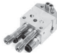
流体口在后部的歧管底座